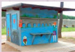
Punto Info Acquadotti decorato dai ragazzi del liceo Argan, 2016.