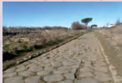
Appia X e XI miglio chiusura progetto riqualificazione, 2016.