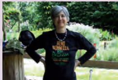
Campagna Meno Monnezza più Bellezza, 2014.