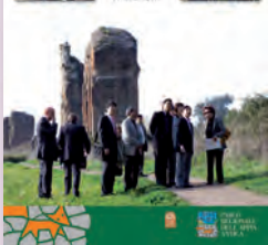
Visita al Parco del futuro Imperatore del Giappone Naruhito, 2010.