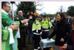
La Presidente della Camera Laura Boldrini alla Festa degli Animali, 2015.