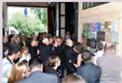
Inaugurazione Arte per l'Articolo 9, 2014.