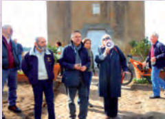
Consegna ufficiale del Casalino Acea ai Volontari per gli Acquedotti, 2017.