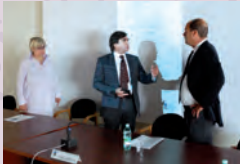
Presentazione Parco Appia Antica Layer, 2011.