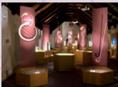
Mostra Archaeomusica, progetto Emap, 2017.

21 ottobre. Viene firmato il manifesto d'intenti "Verso il Contratto di fiume per l'Almone". Primo atto ufficiale con il quale i promotori si impegnano a lavorare alla costruzione del Contratto di Fiume, moderno strumento di governance condivisa, che chiama in causa tutti i soggetti, pubblici e non, interessati alla gestione e al risanamento del fiume Almone e del suo bacino.