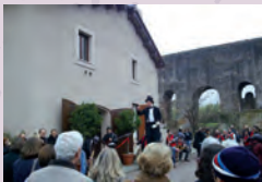
Inaugurazione Casali Tor Fiscale, 2010.