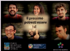
Primo progetto Servizio Civile Nazionale, 2017.