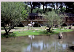
Acquedotti il nuovo laghetto di Roma Vecchia, 2011.