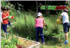
Inaugurazione Hortus Urbis, 2012.