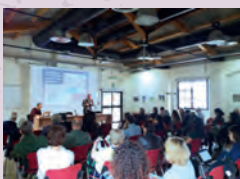
Prima assemblea pubblica per il Contratto Fiume Almona, 2018.