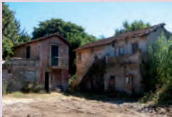
Consegna terreni e immobili Caffarella, 2010.